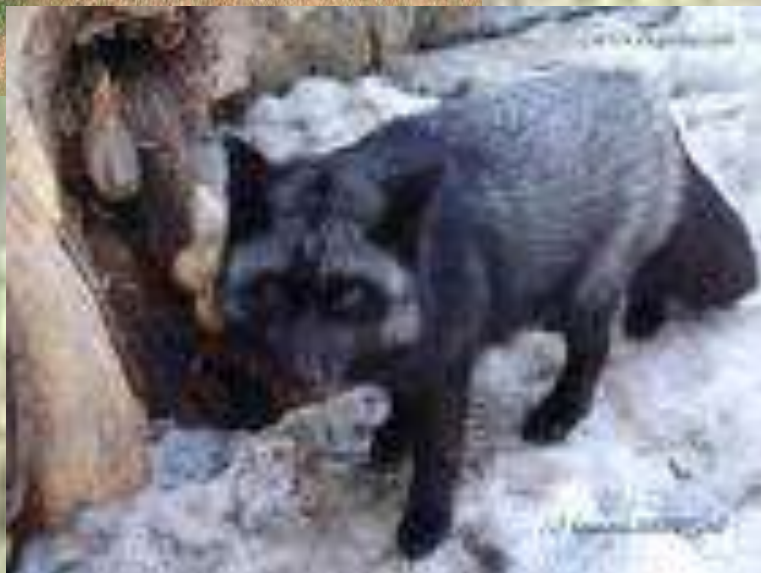
Серебристо – черная лисица