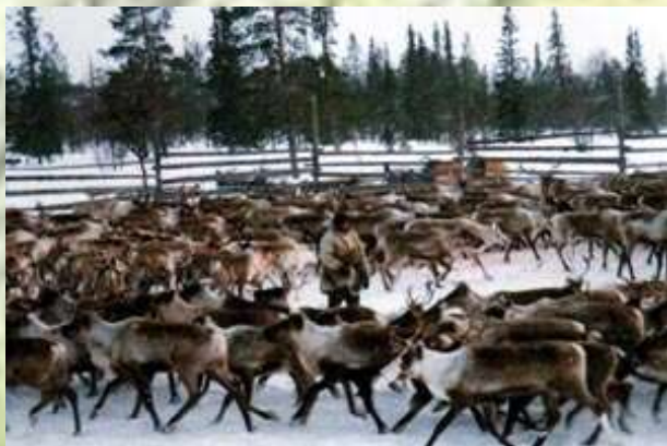
Традиционные занятия народов Якутии (оленьеводство)